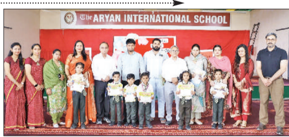
कैथल। द आर्यन इंटरनेशनल स्कूल में रविवार को नर्सरी से कक्षा 5वीं और शिक्षकों की संबोधित करते हुए कहा कि स्कूल का उद्देश्य केवल किताबी तक सीमित शिक्षा देना नहीं, बल्कि विद्यार्थियों को मानसिक रूप से सशक्त और भावनात्मक रूप से संवेदनशील बनाना है। उन्होंने कहा कि यह परिणाम विद्यार्थियों की मेहनत और शिक्षकों के मार्गदर्शन का परिणाम है। परिणाम दिवस के दौरान अभिभावकों का उत्साह भी देखने लायक रहा।