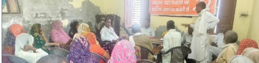
कैथल। सम्मेलन में विचार विमर्श करते अखिल भारतीय खेत मजदूर एवं ग्रामीण मजदूर यूनियन के सदस्य।

अखिल भारतीय खेत मजदूर एवं ग्रामीण मजदूर यूनियन की कार्यकारिणी गठित