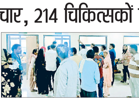
मेडिकल कालेज में ओपीडी के लिए आए मरीज।

अस्पताल के चिकित्सकों के सहारे चल रही है। अब अनुबंध आधार पर चिकित्सकों की भर्ती प्रक्रिया शुरू हुई है। जल्द ही मेडिकल कालेज को चिकित्सक मिल जाएंगे और उसके बाद यहां