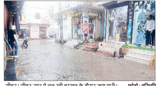
सीवन। सीवन नगर में चल रही बरसात के दौरान जमा पानी।

हरिभूमि न्यूज ► सीवन रविवार सुबह अचानक हुई मूसलाधार बारिश ने जहां मौसम को ठंडा कर दिया, वहीं किसानों के माथे पर चिंता की लकीरें गहरा दी हैं। तेज बारिश के चलते नगर और आसपास के क्षेत्रों की गलियों में कीचड़ फैल गया तथा निचले इलाकों में जलभराव की स्थिति बन गई, जिससे आम जनजीवन भी प्रभावित हुआ। सुबह के समय शुरू हुई तेज बरसात