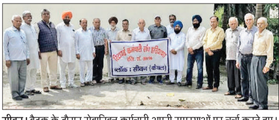
सीवन। बैठक के दौरान सेवानिवृत्त कर्मचारी अपनी समस्याओं पर चर्चा करते हुए।

और मुख्य परीक्षा आयोजित की गई थी, जिसमें नैगेटिव मार्किंग जैसी कठिन शर्तें भी शामिल थीं। इन सभी चरणों को पार करने के बाद जब नियुक्ति पत्र मिला तो उसमें मात्र 6000 रुपये मासिक वेतन निर्धारित किया गया, जिसका विरूपित में कोई उल्लेख नहीं था। उन्होंने बताया कि ज्वाइनिंग के कुछ समय बाद ही सरकार द्वारा नई-नई शर्तें लागू कर दी गईं, जिससे कर्मचारियों का लगातार शोषण हो रहा है।