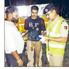
कैथल रात के समय वाहन चालकों के चालान करते पुलिस कर्मचारी

पुलिस द शनिवार रात्रि 11 बजे से सुबह 4 बजे तक विशेष अंतर-राज्य नाका चेकिंग अभियान चलाया गया। अभियान का उद्देश्य क्षेत्र में कानून-व्यवस्था को मजबूत करना तथा अवैध गतिविधियों पर प्रभावी अंकुश लगाना रहा।